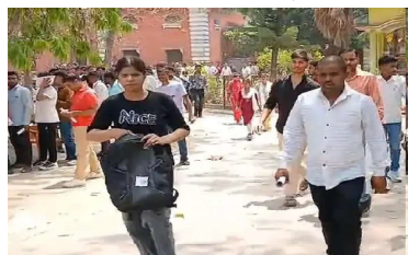
संवाददाता-गोण्डा। जिले में यूपी पुलिस भर्ती एव प्रान्तिगत बोर्ड द्वारा आयोजित तीन दिवसीय यूपी होमगार्ड भर्ती परीक्षा आज सोमवार देर शाम 5 बजे सफलतापूर्वक संपन्न हो गई है। यह परीक्षा 14 केंद्रों पर छह पाठशालों में आयोजित की गई थी। कुल 33,120 परीक्षार्थियों को परीक्षा देनी थी, जिनमें से 26,505 ने भाग लिया और 6,615 परीक्षार्थी अनुपस्थित रहे हैं।