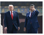
उन्होंने ट्रंप से कहा कि ताइवान के मामले से यदि अमेरिका दूर रहेगा, तो

बीजिंग (आम)। डोनाल्ड ट्रंप और चीनी राष्ट्रपति शी जिनपिंग के बीच दो घंटे वार्ता हुई है। अमेरिकी राष्ट्रपति का यह चीन दौरा बेहद अहम है, जो ट्रेड वार और ईरान में चल रही जंग के बीच हो रहा है। चीनी मीडिया का कहना है कि इस मीटिंग में शी जिनपिंग ट्रेंड लाइन खींची है। उन्होंने कहा कि अमेरिकी और चीन के बीच रिश्ते सामान्य रखने हैं तो फिर ताइवान रोक लाइन है।